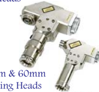
40mm & 60mm Welding Heads