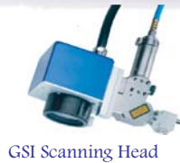
GSI Scanning Head

Standard Compliance: CE, CDRH, Sealed to IP55/NEMA