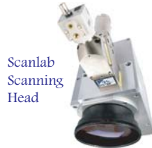
Scanlab Scanning Head