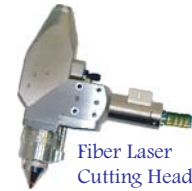
Fiber Laser Cutting Heads