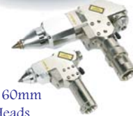
40mm & 60mm Cutting Heads